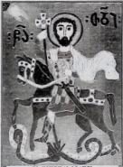
სე თომარია ბიარე ბატერე მარე მანეს

თუფარო გაროსის სიწმიდებოვა გამოეცხადებინა წინდელის მომხელეება ტანდოვად იქცა წინდელს ამ სადებენ ყოველიუბის მარხებსა და მსეულებული მოსახსენებელ დღევანდს.