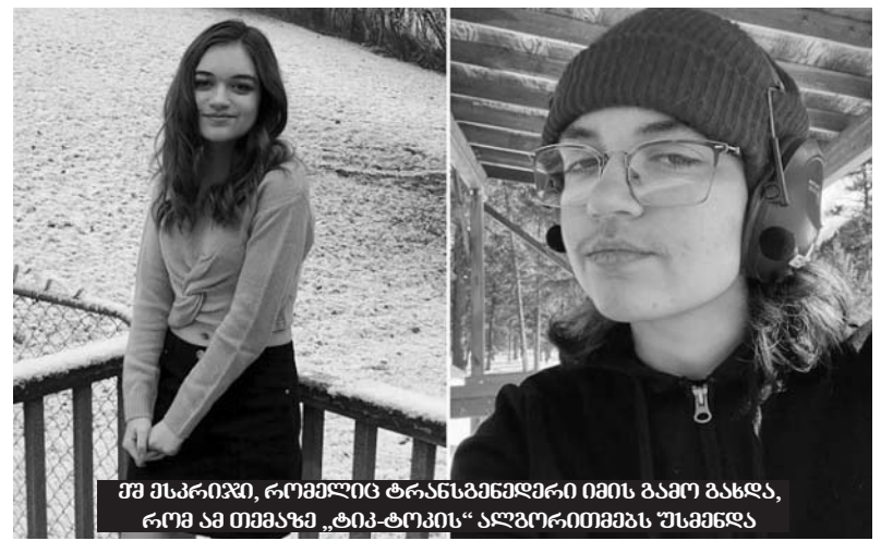
შპს მსპრიპი, რომელიც ტრანსგენდერი იმის გამო გახდა, რომ ამ თემაზე „ტიკ-ტოკის“ ალგორითმებს უსაყვამდა

ავსტრალიაში, სადაც მავნებელი მწერების მიერ მიყენებული ზარალი მილიარდობით დოლარს აჭარბებს, მათთან ბრძოლის ორიგინალურ მეთოდს მიაგნეს — ბიოინჟინერმა მწერები გვებად აქციეს. რენტგენის სხივებით ისე უზიანებენ ქრომოსომებს, რომ მატლებს მხოლოდ მამრი მწერები იბადებიან. ისინი ისედაც წელიწადში ერთხელ წვივდებიან და მეცნიერები ფიქრობენ,