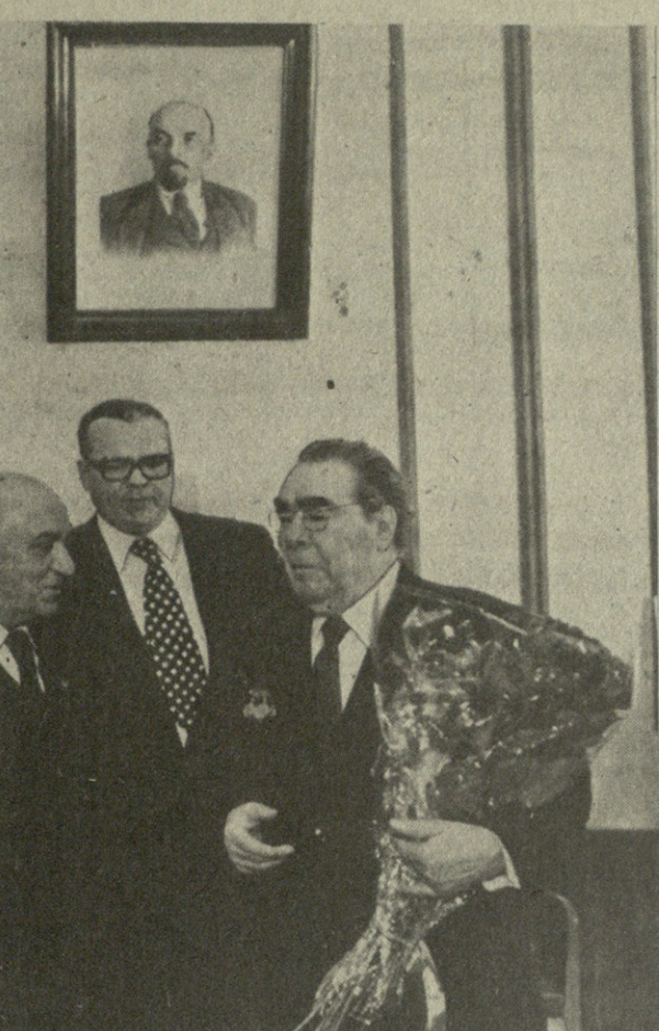
სურათი: რუსეთის უმაღლესი საბჭოს დავუტყუდ პრეზიუმის მოწვევის გადაცემის დროს.

აზნაურის შრომები საზოგადოებრივი განათლების 59-ე წლისგან ბაი