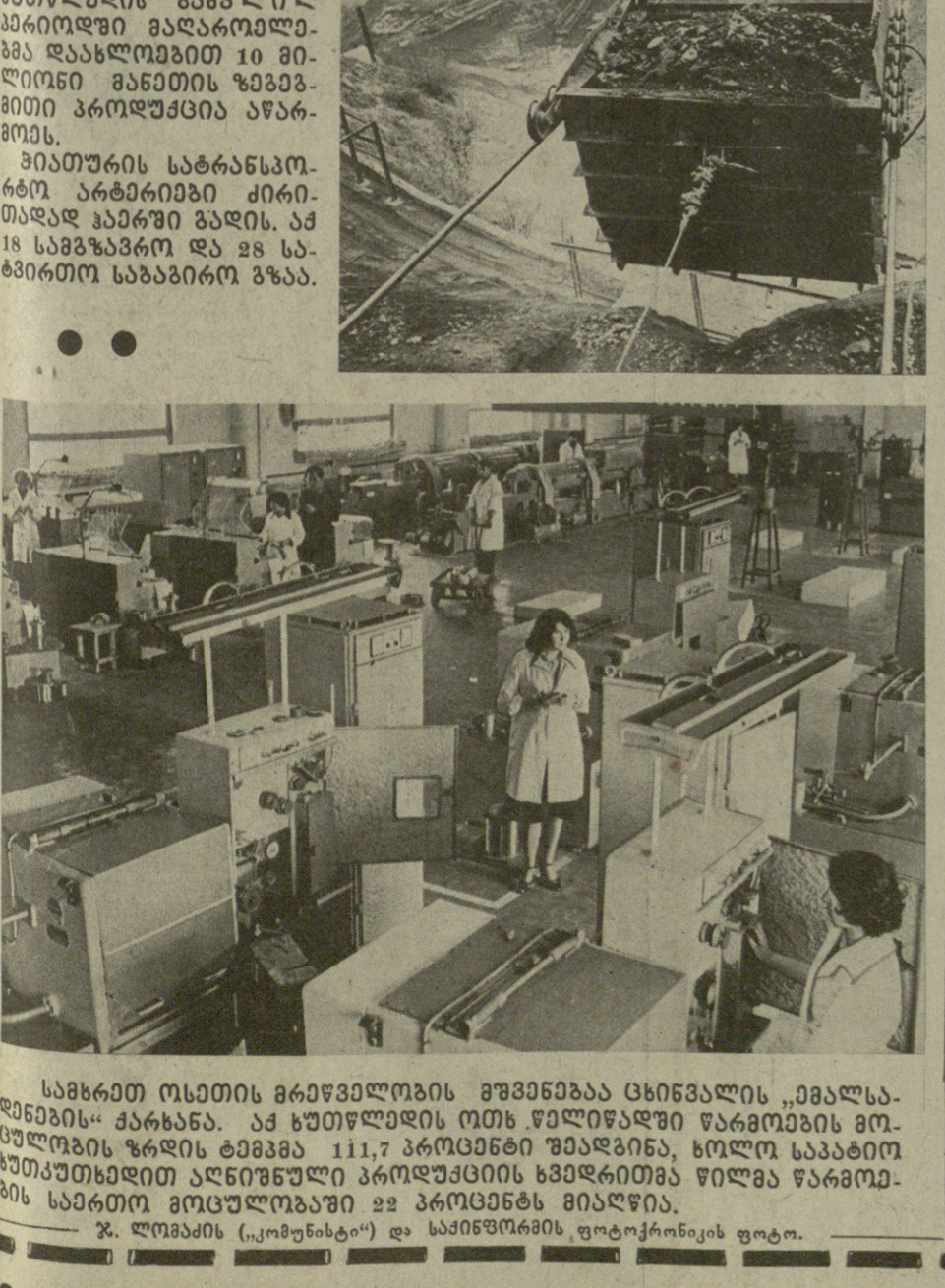
სახსრით ოსტონის მრეწველობის განვითარება ცხინვალის „მალსა-დინამიკის“ ქარხანაში. ამ ხუთწლიანი ოსტონის რეკონსტრუქციის ფარგლებში მრეწველობის რეკონსტრუქციის ფარგლებში მრეწველობის რეკონსტრუქციის ფარგლებში...