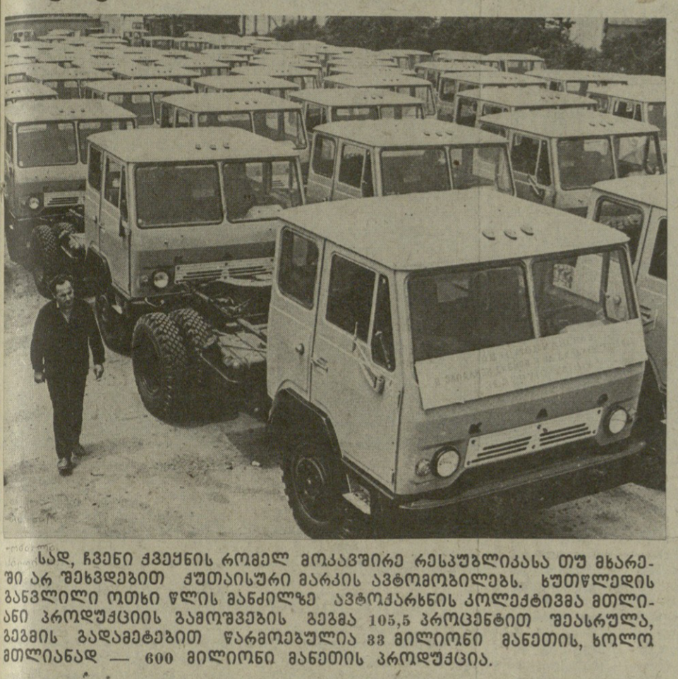
სადაც ჩვენი ქვეყნის რომელიმე მოსახლეს რეკონსტრუქციას თუ მხარგრეობს უნდა იხსენიოს მისი პარტიის მდივანი, რომელიც მისი პარტიის მდივანს უნდა აცხადოს მისი პარტიის მდივანს, რომელიც მისი პარტიის მდივანს უნდა აცხადოს მისი პარტიის მდივანს...