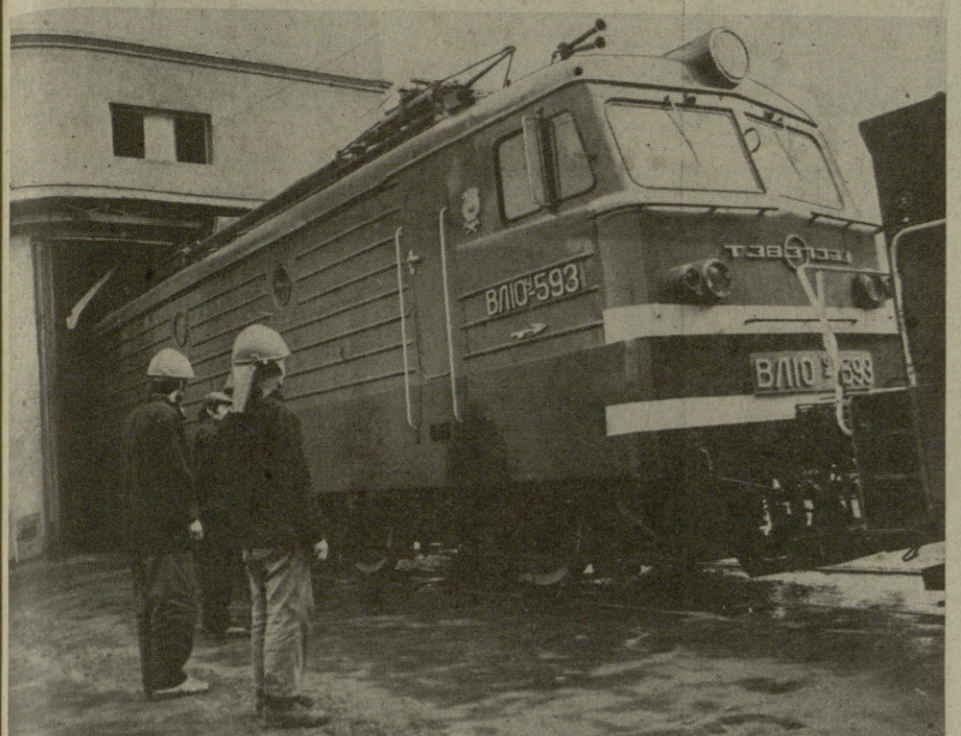
თბილისის საწარმოო გაერთიანება „ელვაგაზფინავალი“ კომპლექსურად მართავს ხუთწლიანი კარგად დაწყებული 1978 წელს, მცხეთა ხუთწლიანი გეგმით დაგეგმიური წარმოების, ამ დაგეგმვის 5-ით მეტი — 120 მილიონი, ეს განხილავს ხუთწლიან რეკონსტრუქციას და ხუთწლიან 4 წლიან რეკონსტრუქციას 500-ს მილიონი. მთლიანად მართავს ხუთწლიან და გეგმიურად 642 მილიონი, რაც მცხეთა ხუთწლიან რეკონსტრუქციას 118-ით, მეტი.