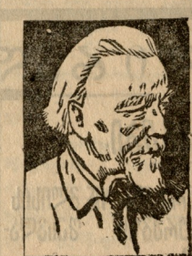
სამეცნიერო აკადემიის პრეზიდენტი კ. პარპინსკი.

სამეცნიერო აკადემია უმაღლესი სასწავლებელია, რომელიც ექსპერიმენტის და არქეოლოგიური გათხრების საშუალებით შეისწავლის სხვა და სხვა ქვეყნებს, მხარეებს, მოსახლეობას მათ ენას, ზნე-ჩვეულებებს, კულტურულ დონეს და სხვ. და მათი საშუალებით იგებს თუ რა საფეხური გაიარა კაცობრიობამ, ან ამა თუ იმ დან მოეზურებიან მეცნიერები ამ იუბილეს დასასწრებლად.