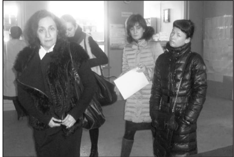
ვის შემთხვევები. საპროტესტო აქციებით ჩონჩაყურის რაიონი გამოირჩევა. ექიმებს გაფიცვა თითქმის ყოველთვიურად უხდებათ, რაც პაციენტებს აზარალებს. პრობლემას „ნაციონალური მოძრაობის“ ხელისუფლებაც აღიარებდა და იმედ-

დაწყებულ საქმეს ღირსეულად დაასრულებს, დედოფლისწყაროელ მოქალაქეებს კი სამკურნალოდ წასვლა მეზობელ რაიონებში აღარ მოუწევთ.