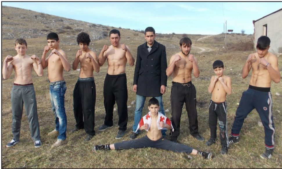
კლუბს მიანიჭეს, ამიტომ კახეთის უზუს ფედერაცია დედოფლისწყაროში განთავსდება,“ - აღნიშნავს ცისკარაული. მწვრთნელის განმარტებით,

ციპლინის გარეშე შეუძლებელია მიაღწიო წარმატებას როგორც საკუთარ თავთან ასევე პროფესიონალურ სპორტულ ასპარეზზე. სირთულეების გადალახვა, დისცი-