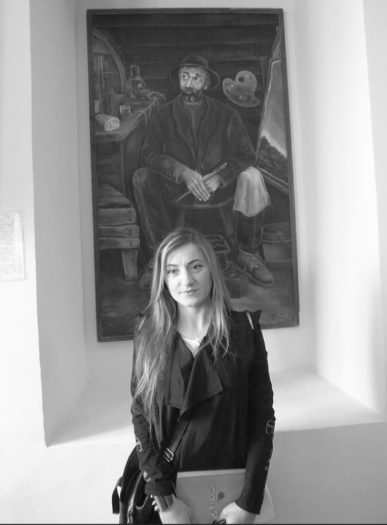
„შემოქმედება ხალხისა და ნებაც მათია, რასაც ხედავენ, ის თქვან. მე მათთვის ვხატავ და თუ ვინმეს ჩემი ნახატები სიახლოვებებს მიანიჭებს, ამითაც ბედნიერი ვიქნები.“

მომრავლებული შედეგები. ორიათასამდე ტილო დახატა ნიკო ფიროსმანაშვილმა და სამწახაროა, რომ მათგან დღეისთვის მხოლოდ ორასიოდე დედანია გადარჩენილი. სწორედ ასეთ შემთხვევაზე უთქვამს ხალხს სანამ გვაქვს არ ვაფასებთ, დავკარგავთ და მივტოვებთ. სწორედ ამ თარიღს ეძღვნება დღევანდელი პერსონალური გამოფენაც და თითქოს სიმბოლურია, რომ სწორედ ფიროსმანის ნაფუძვარზე, მირზაანში აღმოცენდა ახალგაზრდა თვითნასწავლი მხატვარი გოგონა ბელა ლოპჯანიძე. სასურველია, მწარე გამოცდილებიდან ვისწავლოთ, რომ სიცოცხლეშივე დავინახოთ, დავაფასოთ და ხელი შევუწყოთ ნიჭიერებს, - თქვა მან და ესტაფეტა თამარ ლოპჯანიძეს გადასცა, რომელმაც სი-