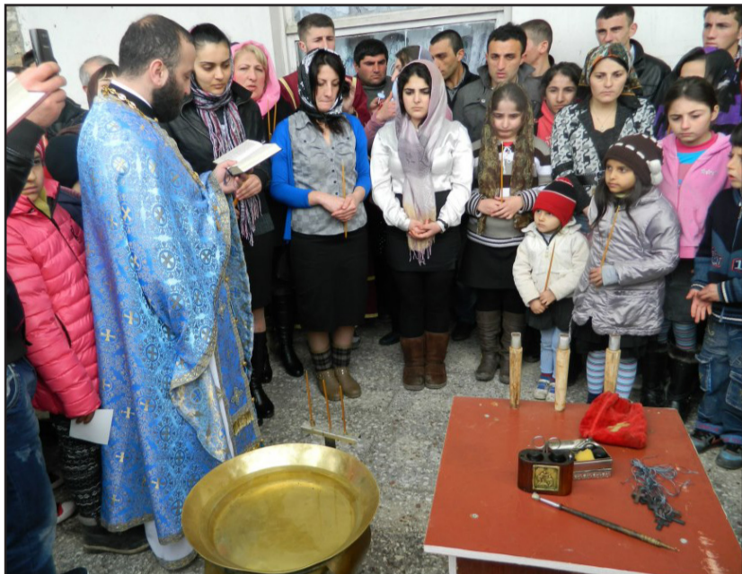
დედოფლისწყაროს მუნიციპალიტეტის სოფელ სამთავართში, აჭარის ავტონომიური რეგიონის საეკლესიო სასახლეში საყოველთაო ნათლობა გაიმართა. სამთავართის სამლოცველო სასახლეში დიდი რაოდენობის ახალგაზრდა და ზრდასრული ადამიანები მიიწვინენ. ქრისტიანულ სარწმუნოებას 30-ზე მეტი ადგილობრივი ეზიარა.

უძღვები შვილის ხსენების დღეს აჭარიდან სამთავართში ჩამოსახლებული ეკომიგრანტები, ინგოლოები და სოფელ ფიროსმანსა და არხილოსკალოში მცხოვრები სხვადასხვა ასაკის ადამიანები მიიწვინენ. ქრისტიანულ სარწმუნოებას 30-ზე მეტი ადგილობრივი ეზიარა.