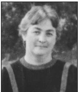
ჩვენო ტკბილო და თბილო დედა, 18 მარტს შენი დაბადების დღეა,