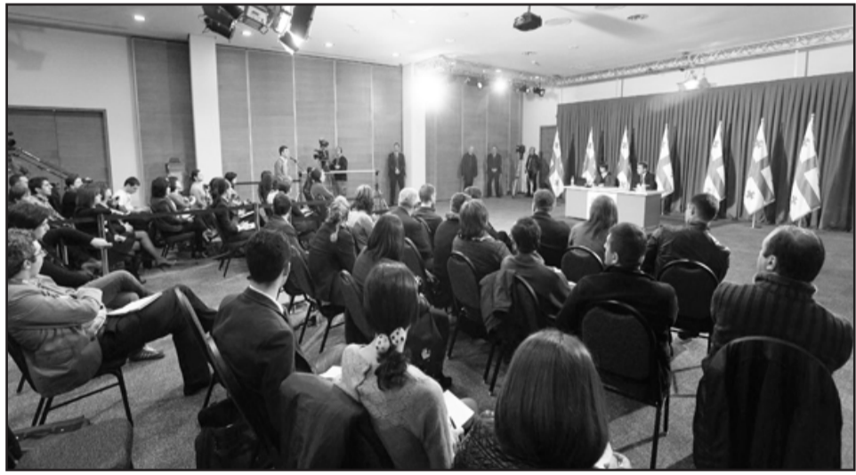
ზრებას იზიარებს და ამ მიმართულებით ცალკეული ნაბიჯების გადადგმასაც გეგმავს. გახეთ „შირაქს“ ბიძინა ივანიშვილისთვის კითხვის დასმის საშუალება მესამე ხუთეულ-

საწყისში ვსაუბრობდი, რომ წელს გაცილებით მეტი თანხები გამოიყო. მე ჩაიხივრ და დავით ნარმანიას აუცილებლად მივცემ თქვენს შეკითხვას კონკრეტულად დედოფლისწყაროზე.