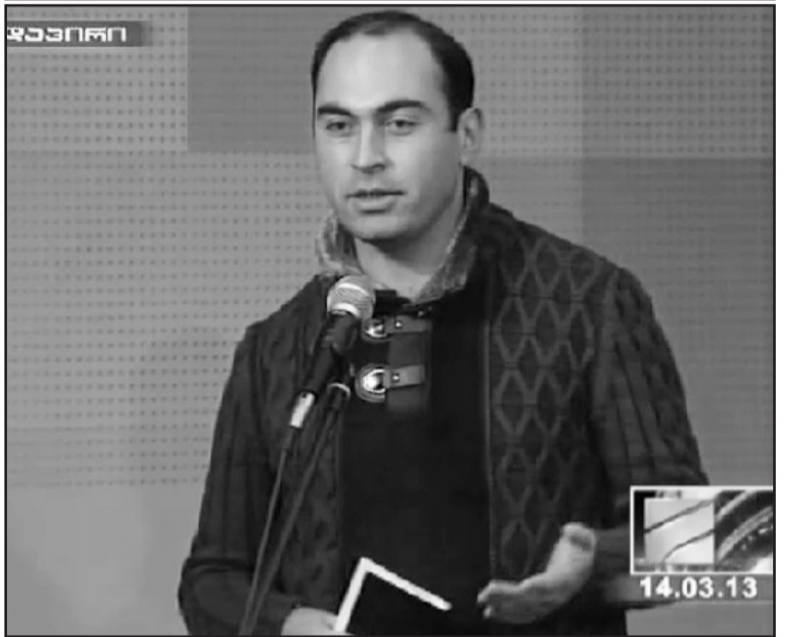
ნიშპილი აპირებს ამიერიდან პრესკონფერენციებს მოსთხოვოს, რამდენიმე პრესკონფერენცია მოაზრებდა და პრემიერს ყოველკვირაულად გააუწყობს.

ამხელა რანგის სახელმწიფო მოღვაწის პრესკონფერენციაზე 12 წლიანი ჟურნალისტიკური საქმიანობის მიუხედავად, პირველად მოხვდები. აქვე ვიტყვი იმასაც, რომ პრემიერის პრესცენტრიდან, რეგისტრაციის გასაველელად თავად დაგვიკავშირდნენ და მონაწილეობა საკუთარი სურვილით შემოგვთავაზეს. ამ დრომდე, როგორც წესი, მედიასაშუალებებს საგანგებოდ არჩევდნენ, პატარა რაიონები და გაზეთები კი არავის ასხენდებოდა. ამიტომ, „შირაქმა“ და სხვა რაიონულმა გამოცემებმა პრემიერის ეს ჟესტი დადებითად შეაფასეს და თანამშრომლობის გაღრმავების სურვილი გამოთქვეს.