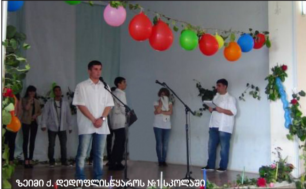
ზეიმი ქ. დედოფლისწყაროს №1 სკოლაში

გუშინ, 16 მაისს, იყო დაგეგმილი სკოლებში ბოლო ზარის შემთხვევის გამო, როცა ავღა- გარდაცვლილთა ახლობლებს და ვისურვებთ, ეს