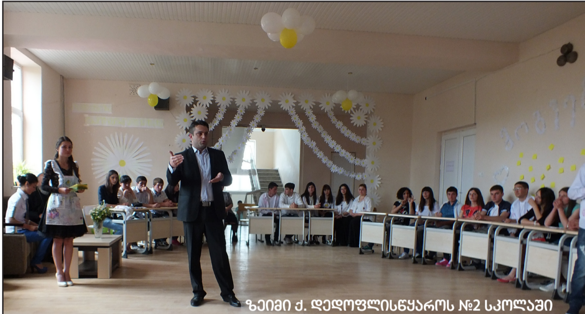
ზეიმი ქ. დედოფლისწყაროს №2 სკოლაში