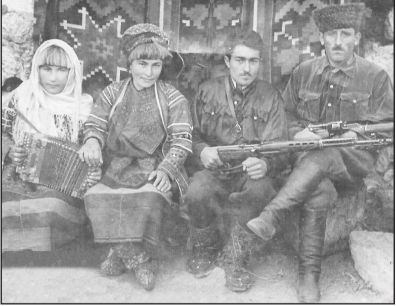
თითქოს მშვიდად უნდა ეცხოვრათ, მაგრამ მთავრობამ მინც გამოარდა ხევსურები და ბარში -წითელწყაროს რაიონში ჩამოასახლა.

ძლებოდა, არც არავინ უნდა დასწრებოდა ამ პროცესს, თავად უნდა მოგველო თავისთვისაც და ახალშობილისათვისაც. თივაბულუ-