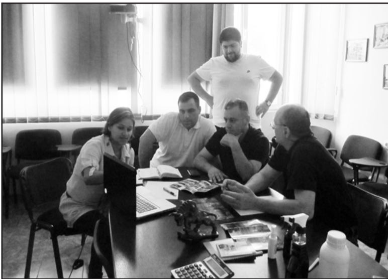
რიანები არიან მეცხვართა ასოციაციები და რა როლს თამაშობენ დარგის განვითარებაში?