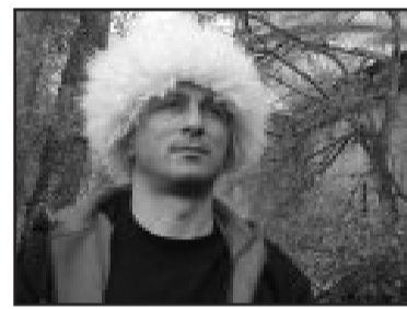
ზე საუბარი ნამდვილად არ გახლავთ. გელას სამი წელია,

ამჯერად მისი რედაქციაში სტუმრობის მიზეზი სპორტ-