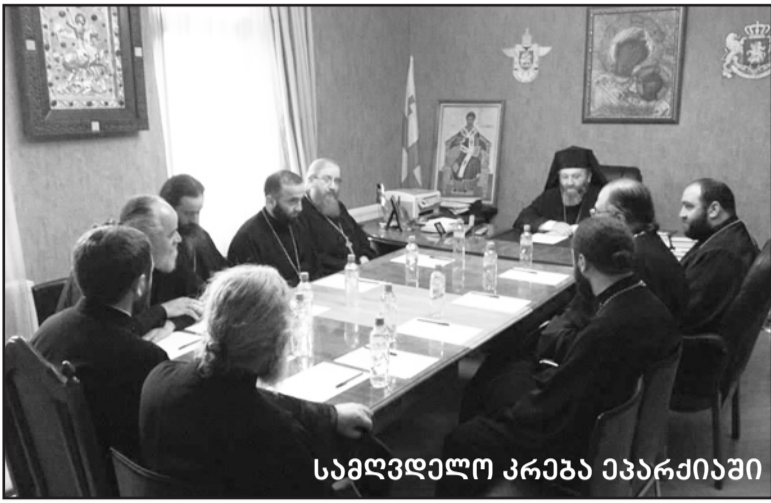
სამღვდლო კრება ეპარქიაში