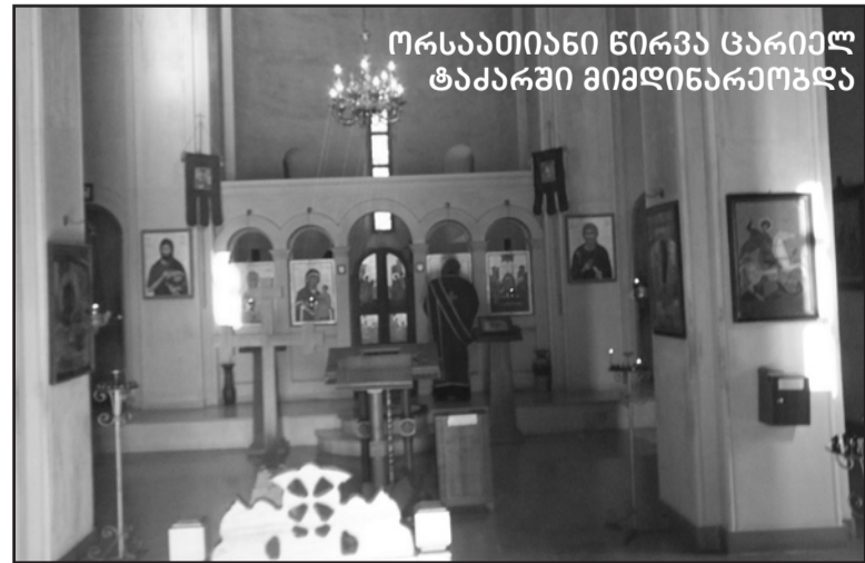
ორსაათიანი ნირვა სარიელ ტაძარში მიმდინარეობდა