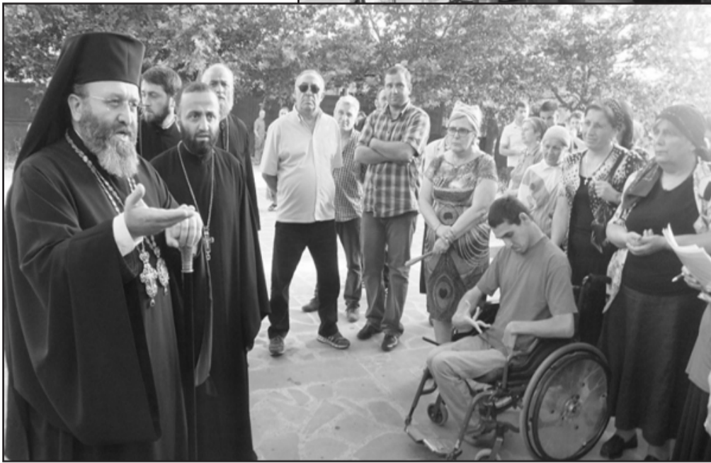
მეუფე მელქისედეკი მრევლს: თქვენ მორწმუნეობის ეტყობა აღარ აფერი გაქვთ, ეს არის მრევლი?..

მონაწილეებმა ხელმოწერები შეაგროვეს. წინასწარი ინფორმაციით, უკვე არსებობს 800-ზე მეტი ხელმოწერა.