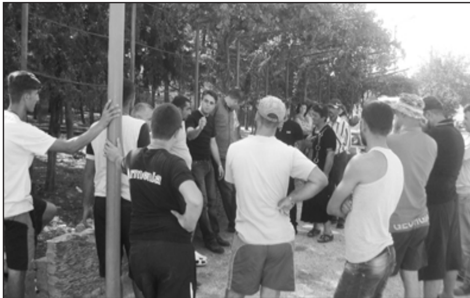
მომავალ წელს სოფლის ცენტრში სკვერის რეაბილიტაცია უნდა მოხდეს, რადგან სოფლის სტუმრებსა და ადგილობრივებს თავშეყრისა და დასვენებისთვის კეთილმოწყობილი ადგილი ჰქონდეთ

გამგებელმა აღნიშნა, რომ წინა ხელისუფლებისგან განსხვავებით, მისი ყველა დაპირება უკვე სრულდება და ამის მაგალითად საბათლოელებს უჩივს, მათივე სოფლის მახლობლად, კაკლისყურის ნაპირსამაგრი სამუშაოების მილიონიანი პროექტი ადგილზე მოინახულონ და ასევე სოფელ ქვემო ქედში ჩავიდნენ, სადაც მათ გზის უპრეცედენტო სარეაბილიტაციო სამუშაოები დახვდებათ. მისი თქმით, კარ-