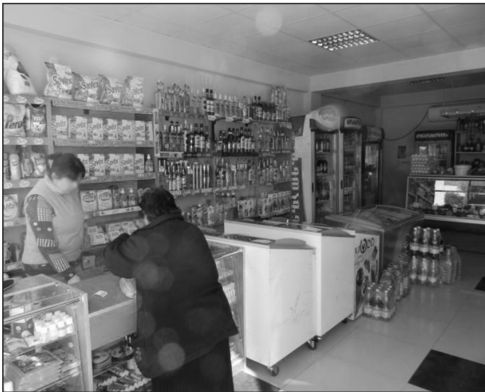
ისმის კითხვა-რატომ აქლავს მაკონტროლებელი ორგანო საქონე პროდუქტის წარმოების, შემოტანის და მაღაზიის დახლეობა დაწყობის უფლებას?

ვითვალისწინებ. რომელ დიასახლისს აწყობს, რომ ზედმეტი თანხა დახარჯოს სუპერმარკეტში, თუმცა, თუ ამის საჭიროებას მაღალი ხარისხის საკვები მოითხოვს, არ უნდა დაგვენახოს ფულის გადახდა. არის კიდევ მეორე მხარე, შესაძლოა გვგონია, რომ მაღალხარისხიანი და ძვირადღირებული ვიყიდეთ, თუმცა, არც მაშინ ვგრძნობთ თავს დაზღვეულად, რადგან ყველამ ვიცით, რომ ჩვენს ქვეყანაში კვების პროდუქტების ხარისხი კვლავ არაა დაცული. ყველაფერს კი ის განაპირობებს, რომ სურსათზე მკაცრი კონტროლი არაა დაწესებული. აქედან გამომდინარე, მოსახლეობის უნდობლობაც საფუძველს არაა მოკლებული. ამ ყველაფრიდან კარგი დიასახლისისთვის საუკეთესო გამოსავალი შინაურ პირობებში წარმოებული პროდუქტია, ყველაზე საუკეთესო ვარიანტია სახლის ქათამი მივირთვათ და ბოსტნეულიც სახლში მოვიყვანოთ, თუმცა, ამ ფორმულას ხშირად ვარღვევთ, რადგან სახლის პროდუქტი ოჯახის სრულყოფილი გამოკვებისთვის არასაკმარისია.“