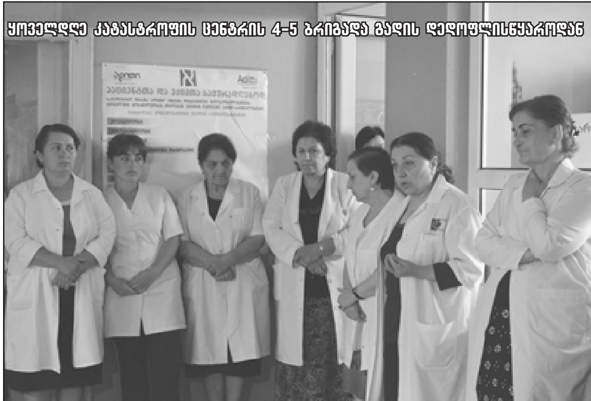
„არქიმედე“ აღარც სტაციონარულ მკურნალობას გვიფინანსებს, მხოლოდ 24 საათიანი გადაუდებელი შემთხვევები ფინანსდება. 3 დღით პაციენტის გაჩერების საშუალება არ გვაქვს“

არ გვაქვს და ეს მიდგომა უნდა დასრულდეს. ყოველდღე კატასტროფის ცენტრის 4-5 ბრიგადა გადის დედოფლისწყაროდან. ჩვენ ამას არ ვიმსახურებთ, ადამიანურ სამუშაო პირობებს ვითხოვთ,“ - აცხადებენ დედოფლისწყაროელი მედიკოსები. „ამ პრობლემების შესახებ „ადითის“ ხელმძღვანელობა საქმის კურსშია. შევხვდით, ვისაუბრეთ, მაგრამ უშედეგოდ... დროულად არ გაიცემა ხელფა-