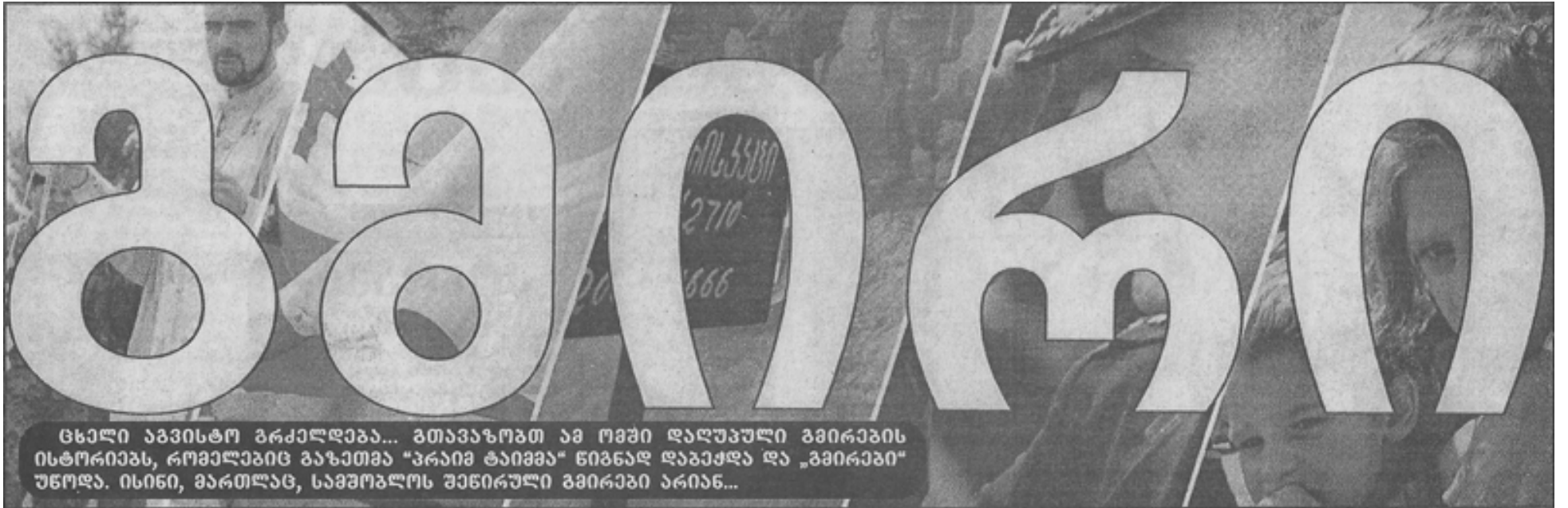
სხელი აპრილით გრძელდება... გთავაზობთ ამ ომში დაღუპული გმირების ისტორიებს, რომლებიც გაუთვალა "პრაიმ ტაიმზე" ნიშნად დააქვდა და „გმირები“ უწოდა. ისინი, მართლაც, სამშობლოს შენობის გმირები არიან...