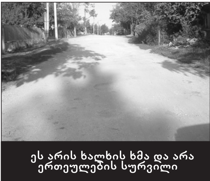
ეს არის ხალხის ხმა და არა ერთეულების სურვილი

ენამთისკენ მიმავალმა მევენახეებმაც ამოისუნთქონ და ამ ქუჩის მაცხოვრებლებმაც. უფლის თვალი ტრიალებს წელს ენამთაში. ზოგიერთი ვენახი, კალიებთან ბრძოლის ინტენსიური ღონისძიებების გატარების მიუხედავად, მაინც დაზიანდა, მაგრამ ძირითადი ნაწილი კარგად მსხმოიარეა. როგორც კარზე მოგვადგა, ერთადერთი სალონისი მევენახეთათვის სწორედ ეს გაუბედურებული გზა გახლავთ, რომელიც ოდესღაც მოსაფალტებული ყოფილა, ახლა სწორედ ადგილ-ადგილ დარჩენილი ასფალტის საფარისა და დროთა უამისაგან წყალს გაყოლილი ხრეშის გამო ისეთი ღრმულებია, მძღოლიც იტანჯება და მანქანაც ინგრევა. დიდი მადლი იქნებოდა, თუ მუნიციპალიტეტის ხელმძღვანელობა