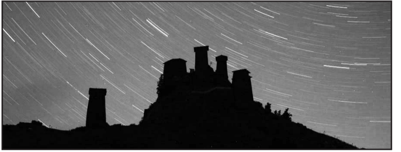
ჟიურის რჩეული ფოტო „ღამით თუშეთი“

ბრაკონიერმა არ მოინადირა! ჩვენ ისევ ფეხით მიფუყვებით „დათვის ხეობას“. ისე ვავიარეთ ორი კილომეტრი, არც გავგვიცა, იმდენ საინტერესო და თვალის საამებელ სანახაობას ვუცქერდით, თუმცა, არც მგლის, დათვის და გარეული ღორის ნაკვალევი გამოგვიჩინია. სეზონი არ არისო და გველთან შეხვედრის შიში არ გვქონდა, მაგრამ გველის წინილს მაინც ვადავანყდით. რადგან საშიში არ იყო, გულდასმით დავათვალიერეთ, ფოტოებზე გადავიღეთ, თუმცა, ისეთი „ნორჩი“ იყო, წარმოიშვა ვერ დავადგინეთ.