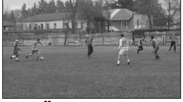
შეჯიბრში ადგილები შემდეგნაირად გადაიდანაწილდა: პირველადგილებზე გავიდა