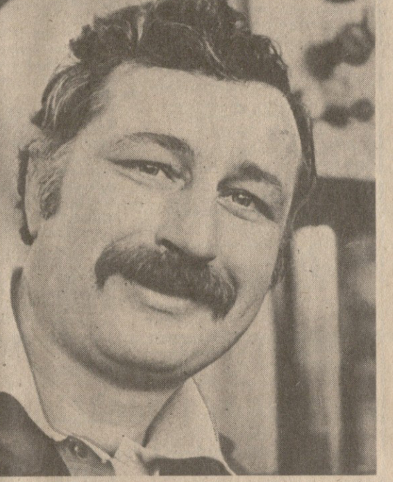
სსრკ-ში მენეჯერებზე ხეობის ბაზელ მენეჯერული ნებისა და ხალხის მხარეზე ერთობლივი ჩვენი შინაგანი ვაჟებისთვის