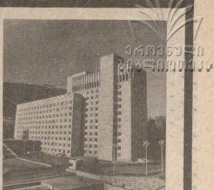
სიტყვა ყრილობის დეკლარაცია

საქართველოს კომუნისტური პარტიის XXVI ყრილობის დეკლარაცია რეგისტრაცია იჭარბოებს ა. შ. 20 იანვრის დილის 9 საათიდან საღამოს 6 საათამდე საქართველოს კომუნისტური ცენტრალური კომიტეტის შენობაში. ტელეფონი: 93-77-30, 93-77-79.