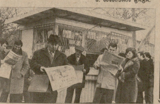
საპარტიო-სსრ უმაღლესი საბჭოს წევრების მხარდაჭერა