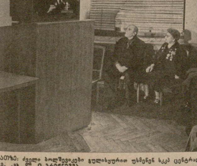
საპარტიო-სსრ უმაღლესი საბჭოს წევრების მხარდაჭერა