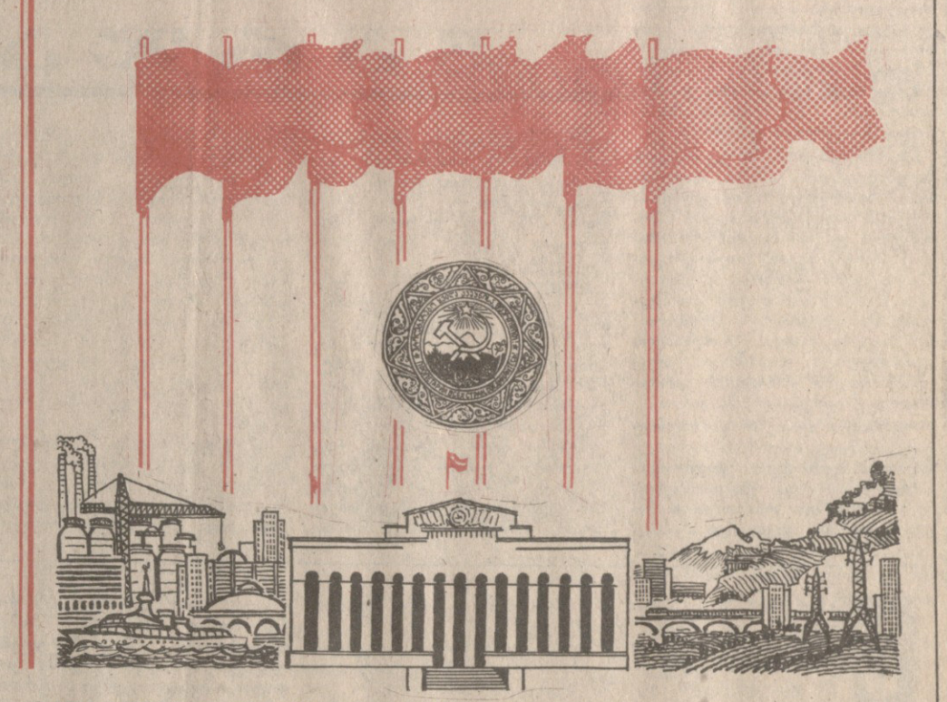
გამარჯვების დროშები ზედიზედ მერვედ.