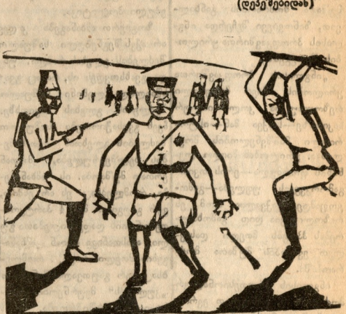
რაც მოგვიან დაეთათო ყველა შენი თავითაო.

სირიაში ფრანგების ჯარის მყოფი ფრანკონიანი ჯარისკაცები წმინდა ვალდინი, თავიანთ მოძმე აჯანყებულთა რიგებში და იბრძვიან ფრანგ მისაგრებლების წინააღმდეგ.