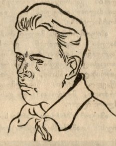
აბ. ციბუში დელეგაციის თავმჯდომარე.