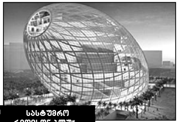
სასტუმრო „რედისონ ბლუ“ — მთაწმინდის პარკის საბაგირო გზის ქვედა სადგურის პროექტი

საჭიროა, დადგინდეს: გაიარა თუ არა ამ უმნიშვნელოვანესმა პროექტმა სრულყოფილად განხილვა-შეთანხმების პროცედურა, რატომ ვერ „შეამჩნია“ არქიტექტურულმა სამსახურმა (საბჭომ) ქვედა სადგურის არქიტექტურული მეორადობა (პლაგია-