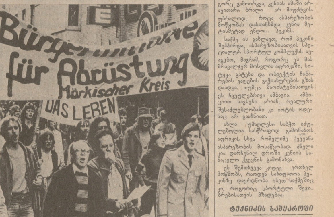
დასავლეთის დემოკრატიული პროტესტი