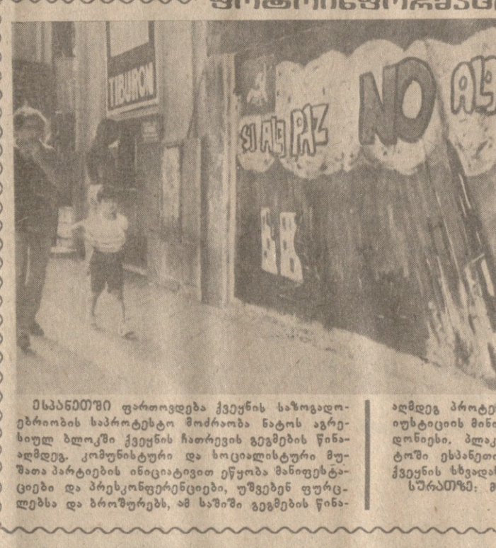
საბინათში ფართობიდან ქვეყნის საზოგადოებრივი ინჟინერული...