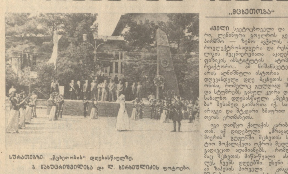
სახალხო. „მეცხეთის“ დღესასწაული. 3. ნახატირევილია და ლ. ხარხაშვილის ფოტოები.

მეცხეთის დღესასწაული. სახალხო. „მეცხეთის“ დღესასწაული. 3. ნახატირევილია და ლ. ხარხაშვილის ფოტოები.