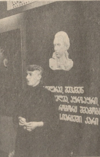
სურათი: ლენინის მონაწილეობა ჯგუფი ლენინის ურთიერთობის სახელმწიფოში.