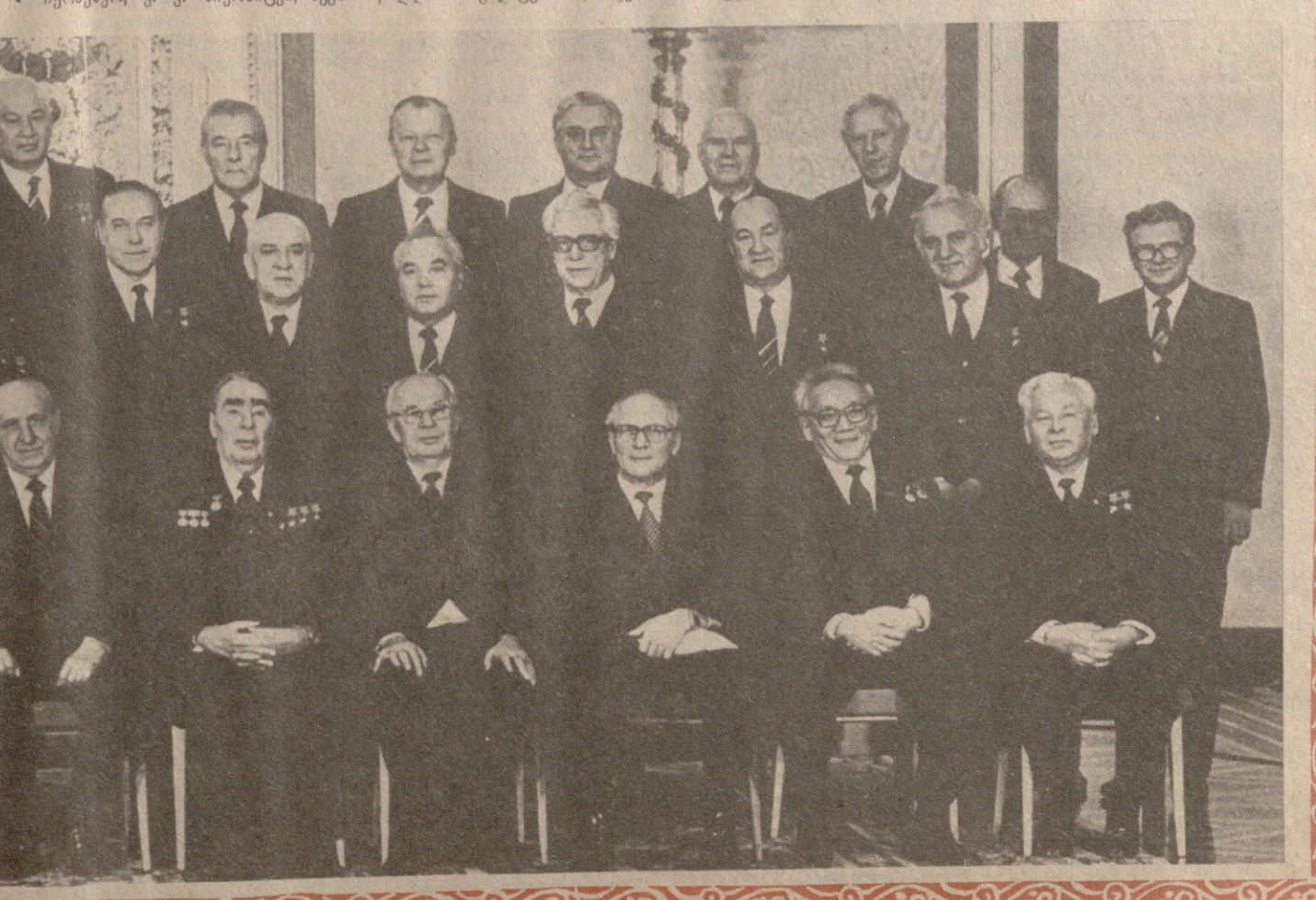
სურათი: ჯილდოების გადაცემისას.

მე, რათა სულითა და გულით მო- მელოცა თქვენთვის, ამხანაგო ბრეჟნევი, დაბადების სამოცდა- თხუთმეტი წლის თავი, რათა ამ სასახლეში მოვლენასთან და- კავშირებით შესაძლეს გადმოეცა თქვენთვის ბულგარეთის სახალ- ხო რესპუბლიკის გმირის ოქროს ვარსკვლავი და გიორგი დიმიტ- როვის ორდენი. ბედნიერი ვარ, რომ წილად მხვდა დიდი პატივი გამოვბატო სოციალისტური ბულგარეთის ყველა კომუნისტისა და მშრომე- ლის უსაზღვრო მადლიერება, ღრმა პატივისცემა და მებრუნა- ლეობა. (დასასრული მე-2 გვ.)