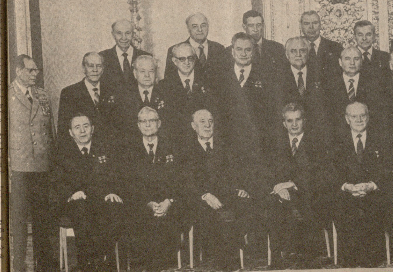
სურათი: ჯილდოების გადაცემისას.

სსრ კავშირის უმაღლესი საბჭოს პრეზიდიუმის პირველი მოადგილე ვ. კუჩნაძე. სსრ კავშირის უმაღლესი საბჭოს პრეზიდიუმის მდივანი მ. გიორგაძე.