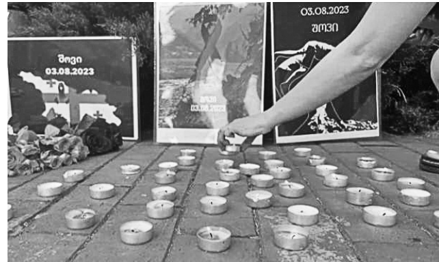
გლოცულობთ მათზე“, - ითქვა შეკრებაზე.

ჩვენს ქალაქში უკრაინიდან ჩამოსულმა სტუმრებმა ევროპის მოედანზე შოვიში სტიქიის დროს დაღუპული ადამიანების პატივსაცემად სანთლები დაანთეს და ტრაგედიის ამსახველი ფოტოასალები გამოფინეს, ასევე იქაურობა სიმბოლურად ყვავილებით მორთეს. მათი თქმით, ამ ფორმით შოვიში გარდაცვლილი ოჯახებს სამძიმარს უცხადებენ. „უმძიმესი ტრაგედია მოხდა. ვიზარებთ ოჯახების მწუხარებას. ჩვენ მეგობარ ქართველ ერს ღვერდით ვუდგავართ ამ მძიმე წუთებში. ძალიან მძიმე დღეებია, რასაც განვიცდით და