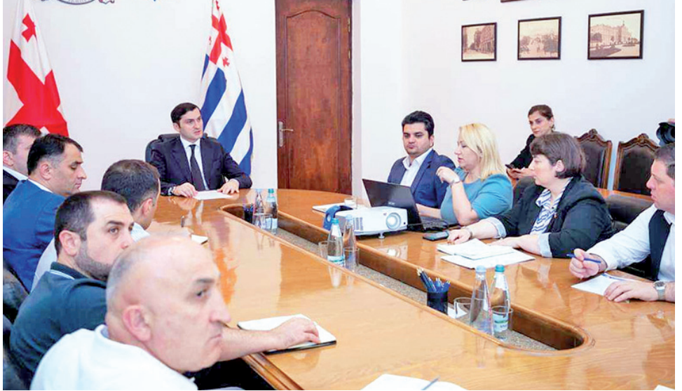
აჭარის მთავრობაში გამართულ შეხვედრაში აჭარის ფინანსთა და ეკონომიკის მინისტრი, ბათუმის მერი, შინაგან საქმეთა სამინისტროს, აჭარის მთავრობის, ტურიზმის დეპარტამენტის ხელმძღვანელი პირები ესწრებოდნენ.

Airbnb-ის მონაცემებზე დაყრდნობით, კერძო ბინების დატვირთვა 2023 წლის 7 თვის მონაცემებით, გასული წლის ანალოგიურ პერიოდთან შედარებით გაზარდილია 38%-ით, ხოლო 2019 წლის ანალოგიურ მაჩვენებელთან შედარებით - 58%-ით. ბათუმი სექტემბრის ბოლოს მსოფლიო ტურიზმის სფეროში დაჯილდოების გალაკერემონიისთვის ემზადება. ღონისძიების მაღალ დონეზე ჩატარების მიზნით, საორგანიზაციო საკითხები განიხილა აჭარის მთავრობის თავმჯდომარემ სხვადასხვა უწყების ხელმძღვანელ პირებთან ერთად. მსოფლიოში ტურიზმის ოსკარის სახელით ცნობილ World Travel Awards-ის ღონისძიების ფარგლებში, ბათუმს მსოფლიოს სხვადასხვა ქვეყნიდან ტურიზმის ინდუსტრიის წამყვანი კომპანიები, სასტუმროები, ტურსაგენტოები, ბიზნეს და სახელმწიფო ორგანიზაციების, ასევე საერთაშორისო მედიის წარმომადგენლები ეწვევიან, სადაც ევროპის წამყვანი ტურისტული მიმართულებები, ქალაქები და კომპანიები გამოვლინდება.