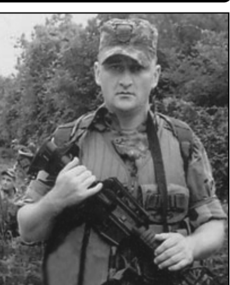
ლობამ 2012 წლის 8 აგვისტოს, მახინჯაურში ერთ-ერთ ქუჩას თეიმურაზ ბერიძის სახელი მიანიჭა.

კაპრალი თეიმურაზ ბერიძე 2008 წლის 11 აგვისტოს შინდისში დაიღუპა, იგი საქართველოს პრეზიდენტის 2009 წლის 6 იანვრის N7 განკარგულებით დაჯილდოებულია მედლით „მხედრული მამაცობისთვის“, მისი სახელის უკვდავსაყოფად კი ბათუმის თეიმურაზე-