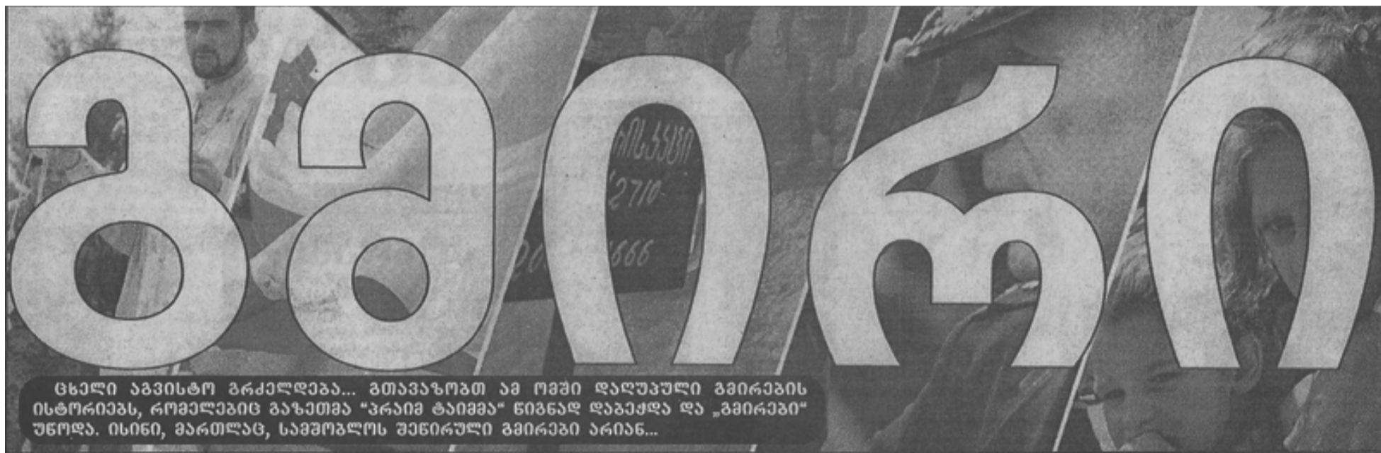
ცხელი აპრილი გვირგვინი... გთავაზობთ ამ ომში დაღუპული გვირგვინის ისტორიებს, რომლებიც გახდნენ "პაიტი ტაიტი" ნიშნად დაბრუნდა და „გვირგვინი“ უწოდდა. ისინი, მართლაც, საბრძოლო ვიდეოები გვირგვინი არიან...