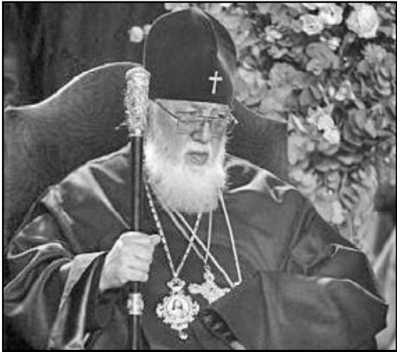
სსსრ კვეყნის მოქალაქეებზე საქართველოში მიწის გასხვისების პროცესთან დაკავშირებით, საპატრიარქო სრულიად საქართველოს კათოლიკოს-პატრიარქის განცხადებას ავრცელებს.

— დღეს, როდესაც მძიმე სოციალურ-ეკონომიკური მდგომარეობის გამო სოფლად მცხოვრები მოსახლეობის დიდი უმრავლესობა სიღატაკის ზღვარზეა და ბევრ შემთხვევაში, იძულებულია თავისი ქონება ძალზე იაფად გაასხვისოს, ახალი რეალობა დიდი დარტყმის წინაშე დააყენებს სახელმწიფოს. თავისთავად უცხოური კაპიტალისა და თანამედროვე ტექნოლოგიების დამკვიდრება მისასაღებელია, რადგან შეუძლებელია ამის გარეშე ქვეყნის განვითარება. მაგრამ ეს პროცესი უმარტაი არ უნდა გახდეს. მან არ უნდა განაპირობოს ყველაზე დიდი მატერიალური სიმდიდრის, ჩვენი მიწა-წყლის დაკარგვა და ჩვენი მოქალაქეების მხოლოდ მოსამსახურე პერსონალად გადაქცევა. არ უნდა მოხდეს ისე, რომ ამ ქვეყნის მკვიდრთ, რომელთაც, პირველ რიგში, ეკუთვნის აქაური სიკეთე და დოვლათი, აღარ ჰქონდეს შიდასამყარო რესურსების გამოყენების საშუალება, — აღნიშნულია განცხადებაში.