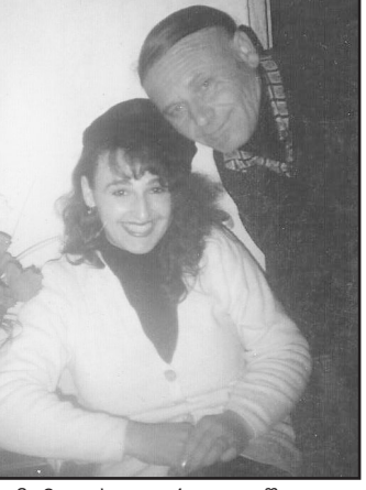
ჩემო საყვარელო შვილო, ლალი, უკვე მეთედ მოვიდა შენი საყვარელი გაზაფხულის თვე - მარტი. შენ ხომ მარტის

თვეში ხარ დაბადებული. ოცდახუთი წელი გვიხაროდა 19 მარტის მოსვლა შენს ახლობლებს. ახლა კი ცრემლით და დიდი გულის ტკივილით ვხვდებით ამ დღეს. რაც დრო გადის, უფრო მეტად გვენატრები და გვიყვარხარ ყველას. შენს დას და დისშვილებს ძალიან ენატრები. ჩემო შვილო, შენმა ჭკვიანმა და უთქმელმა მამამ მე დამტოვა და შენთან წამოსვლა არჩია. ათი წლის უნახავი შვილი გულში ჩავიკრა. ჩახუტეთ შეილო, ერთმანეთს, ისე, როგორც ამ სურათში ხართ. ასე იყავით ჩახუტებულები ჩემს მოსვლამდე. მარია მაქლარაშვილი