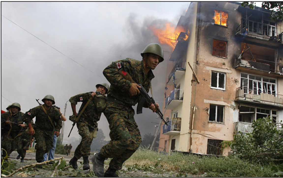
საქართველოში უკვე მეოთხედ სოფლის კვირეული ცხადდება. ეს დღეები საშუალებას გვაძლევს, კიდევ ერთხელ გავისხვიოთ და პატივი მივუგებოთ აგვისტოს ომში დაღუპულ მებრძოლთა სულებს... უკვე მეოთხედ