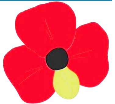
კრწანისის მსგავსად წლების შემდეგ უკვე მინდისა თუ ერგნეთში რომ ამოხეთქავს...

ნითელი ყაყაჩოები კი, მე პირადად, ლადო ასათიანის ლექსს და 300 არაგველის გმირულ ისტორიას უფრო მახსენებს, ქართველების სისხლით გაპოხიერებულ მინას