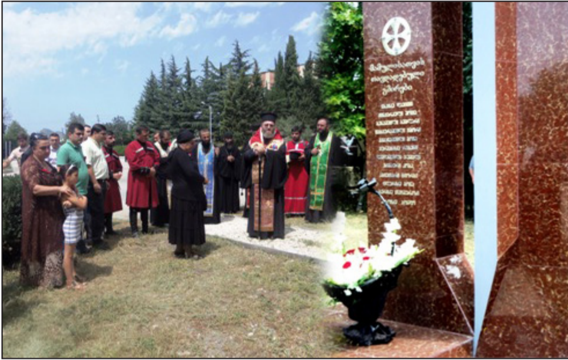
საქართველოში რუსეთის აგრესიიდან ოთხი წლისთან- ვი დედოფლისწყაროშიც აღ-