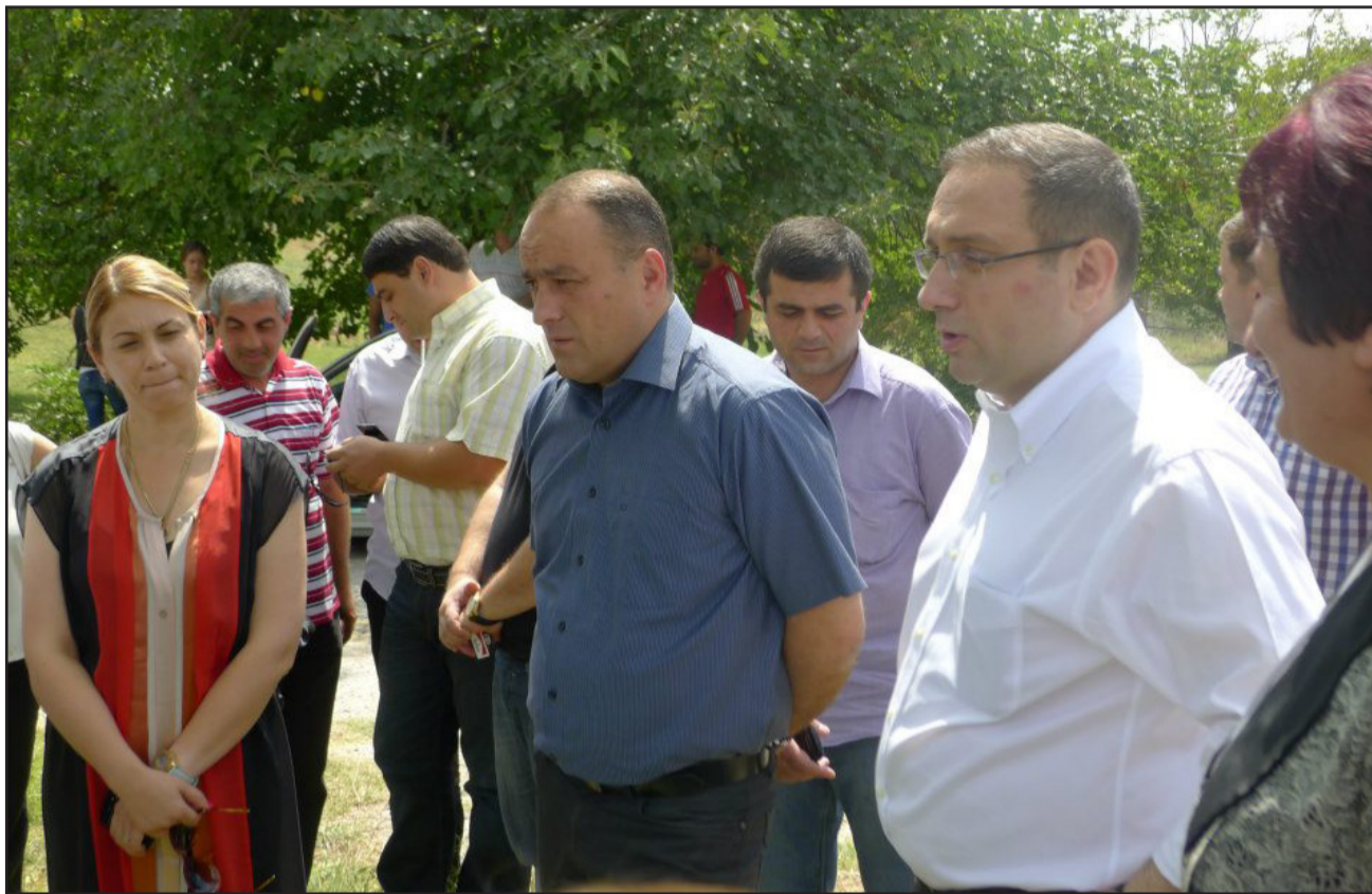
15 აგვისტოს საქართველოს კულტურისა და ძეგლთა დაცვის მინისტრი ნიკოლოზ რურუა ნიკო ფიროსმანის სახლ-მუზეუმის თანამშრომლებსა და მირზანაელას შეხვდა. მან მუზეუმის თანამშრომლებთან ერთად კიდევ ერთხელ მოისმინა ის პრობლემები, რომელიც ცნობილი მხატვრის ბარამოს სრულყოფისთვის მოსაგვარებელ საკითხთა ნუსხაშია. მინისტრმა ფიროსმანის მუზეუმს საჩუქრად საოფისი ავეჯი, კომპიუტერი და პლანეტარული გლობუსი გადასცა.

მ ი რ ზ ა ა ნ - შ ი ფიროსმანის სახლ-მუზეუმის რეაბილიტაცია ყოველწლიურად ეტაპობრივად მიმდინარეობს. 2009 წელს მუზეუმში პირველად მონესრიგდა ელექტროენერჯის პრობლემა, წყლისა და გაზის გაყვანილობა, შეიცვალა შენობის სახურავი და გასულ წელს განახლდა მუზეუმის საექსპოზიციო სივრცე. მიმდინარე წელს ფიროსმანის სახლ-მუზეუმი მთლიანად განასრულებს, მუზეუმის ტერიტორიაზე და მთავალიერებლებისათვის მოწყობა სველი წერტილები და მონესრიგდება ტურისტული ინფრასტრუქტურა. ნიკოლოზ რურუა: “მირზანაში იყო პრობლემები, რომელიც ძირითადად, მუზეუმის ინფრასტრუქტურის მოწყობას ეხებოდა. მე აქ ვარ იმიტომ, რომ ის დანარჩენი პრობლემები, რომლებიც ხელს უშლის ტურიზმის განვითარებას, მონესრიგდეს და, მსოფლიო მნიშვნელობის მხატვრის გარემოში, რაც შეიძლება ბევრმა ბევრმა ტურისტმა მოიყაროს თავი” — განაცხადა მინისტრმა ნიკო ფიროსმანის სახლ-მუზეუმში ვიზიტისას. საქართველოს კულტურული მემკვიდრეობის დაცვის ეროვნული სააგენტოს დაფინანსებით უკვე დაგეგმილია ფიროსმანის ორი ნამუშევრის - „მწლიარე ქართველი ქალის“ და „თამარ მეფის პორტრეტის“ რესტავრაცია. მირზანაში ვიზიტის შემდეგ საქართველოს კულტურისა და ძეგლთა დაცვის მინისტრი, კახეთის გუბერნატორთან და სხვა თანმხლებ პირებთან ერთად, ქალაქ დედოფლისწყაროს მოსახლეობას შეხვდა და მათ ხელისუფლების მიერ დაგეგმილ რეფორმებზე ესაუბრა. ინგა შიოლაშვილი