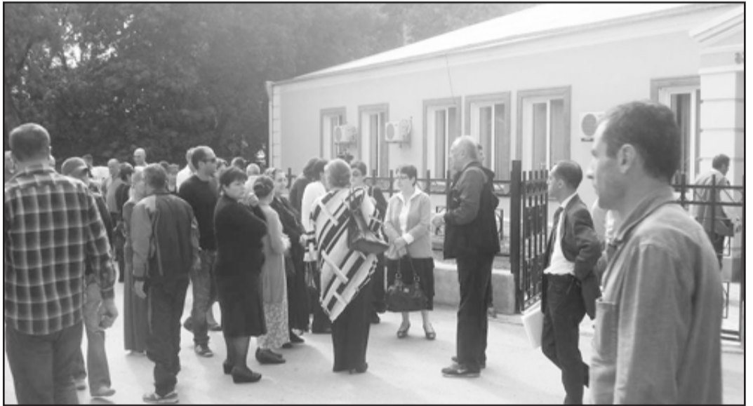
„შენუხებულები ვართ, რომ ჩვენი სიმართლე ვერ გავიტანეთ, ხსენებულ უბანში მოსახლეობამ თავისი არჩევანი თავისუფლად ვერ გამოხატა, იყო ტერორი“

„სერიოზული დარღვევები რომ ყოფილიყო, სასამართლო ამ გადაწყვეტილებას არ გამოიტანდა. უფლება აქვთ, რომ გაასაჩივრონ და ასაჩივრებენ... არჩევნები ჩატარდა სწორად და სამართლიანად... ამ არჩევნებში მცირე უპირატესობით, მაგრამ მე გავიმარჯვე. ეს ყველაფერი თე-