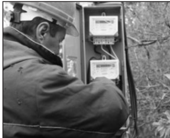
რატომ ახდენენ მანკად მანკ მალალი მარჯვნივით?!

როგორც აღმოჩნდა, დროში განელი დამირების მოგვარება მხოლოდ წინასწარჩენით დადგა დღის წესრიგში, ამასთან, თითქოსდა უფასოდ დამონტაჟებული მრიცხველები, აბონენტებისთვის მართალია სხვა ფორმით, მაგრამ მაინც უფასოდ აღმოჩნდა.