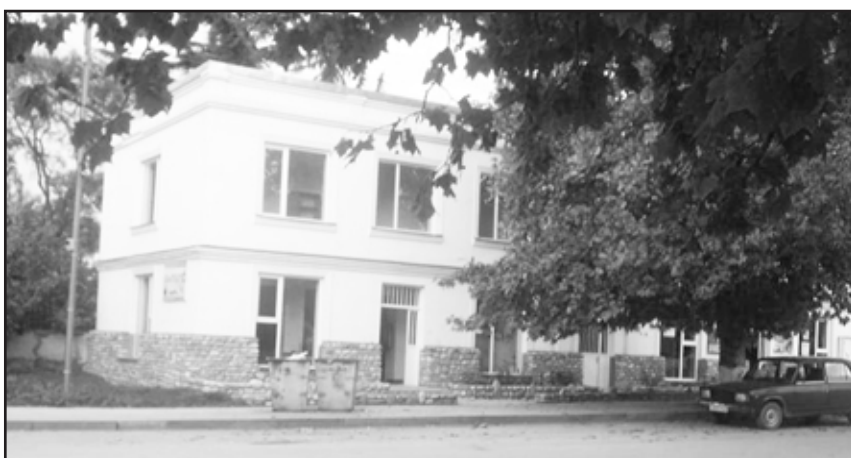
ნარჩენებმა კი კარის ჩამკეტილია დატოვეს, რამაც მათ შენობაში შეღწევა გაუადვილა.

ერთ-ერთი ვერსიით, მაღაზიის დახურვამდე ცოტა ხნით ადრე რამდენიმე ახალგაზრდა გამყიდველის გართობას ცდილობდა, და-