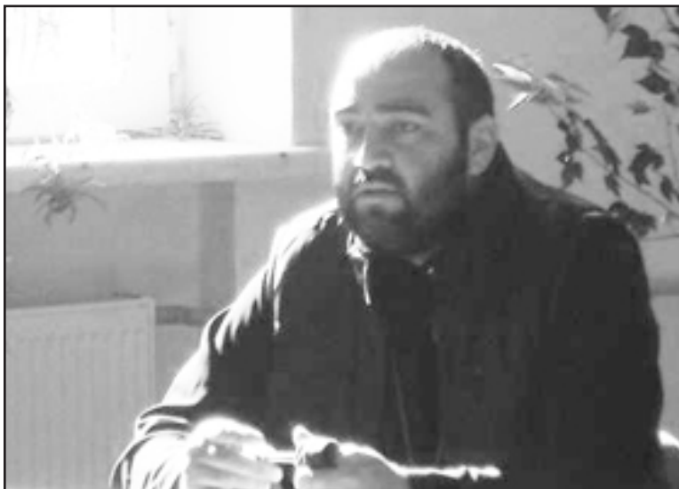
ნენ. გაზეთი „შირაქი“ რამდენიმე მათგანს გაესაუბრა.

შეხვედრაზე განხილული საკითხები უდაოდ საჭირობოროტო და აქტიუალური იყო. მოსწავლეები ძალიან აქტიურობდნენ. საუბარი შეეხო ძალზე საინტერესო საკითხებს. მაგალითად: რას ურჩევს ეკლესია ავტორიტეტებს, ასევე როგორ უნდა მოიქცნენ ნიჭიერი ბავშვები, ხიბლში რომ არ ჩავარდნენ. ეს ყველაფერი ეკლესიამ ბავშვებს ძალიან კარგად აუხსნა. ჩაცმის კულტურაზე იყო საუბარი, როგორ უნდა იცვამდნენ გოგონები და ბიჭები სკოლაში თუ ეკლესიაში. საბოლოო ჯამში, შემოიღო გულწრფელად ვთქვა, რომ ძალიან ნაყოფიერი შეხვედრა იყო, ჩვენი სკოლისთვის ამგვარი შეხვედრა უცხო