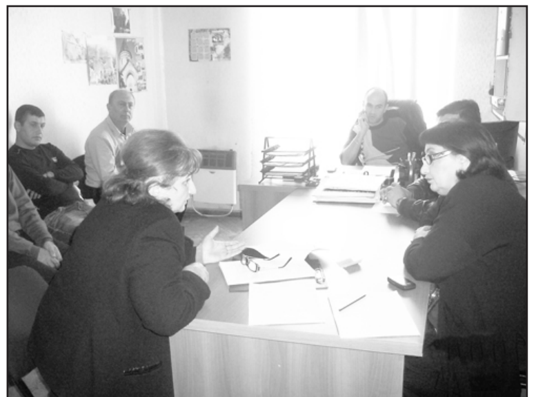
მიზნით, დედოფლისწყაროს მუნიციპალიტეტის 2012 წლის ადგილობრივი ბიუჯეტის სარეზერვო ფონდიდან გამოიყო 10 000 ლარი. შტაბის წევრებმა მიზანშეწონილად ჩათვალეს

აღნიშნული თანხა ახლადგაჩენილი სამარხი კერების დასაბეტონებლად და შემოსალობად, ასევე, საბათლოში არსებული ძველი სამარხი კერის გასაახლებლად გამოიყენონ.