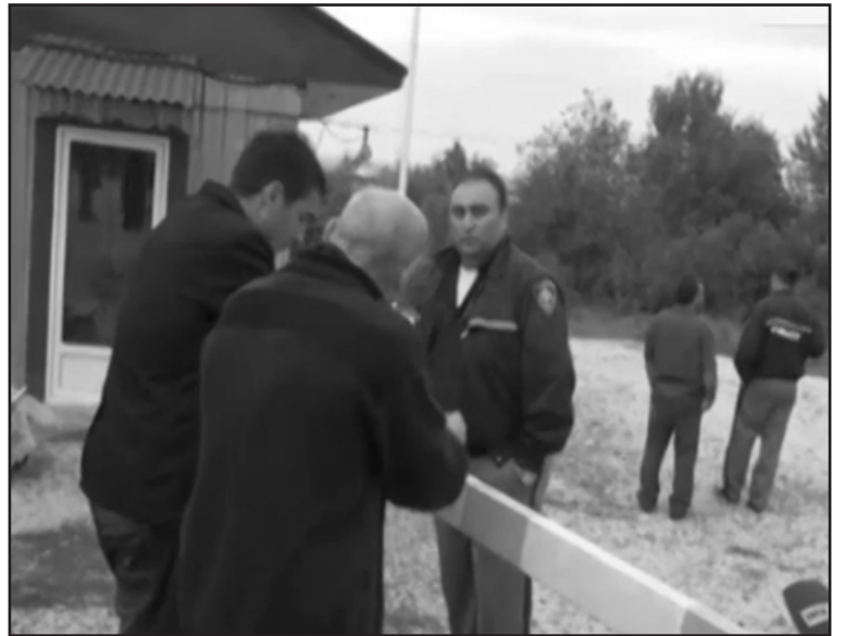
ბის ბრძანებით აიკრძალა სამთაწყაროდან საინგილოში მიმოსვლა.

შეგახსენებთ, 2008 წლის საპარლამენტო არჩევნებამდე ცოტა ხნით ადრე ხიდი დროებით გახსნეს, თუმცა, მიმოსვლა მალევე აიკრძალა. საიდუმლო იყო ისიც, კონკრეტულად რომელი უწყე-