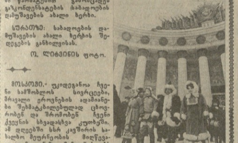
ს. სპირიძის ხელმძღვანელი მ. დელაქოვიანი