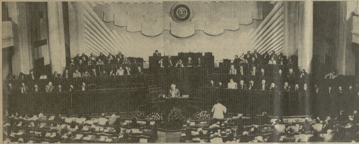
თბილისი, 1982 წლის 2 ივლისი. საქართველოს სსრ მეათე მოწვევის უმაღლესი საბჭოს მეხუთე სესიის სხდომათა დარბაზში.

№ 155 (18397) შაბათი, 3 ივლისი, 1982 წელი ზარი 3 აკა.