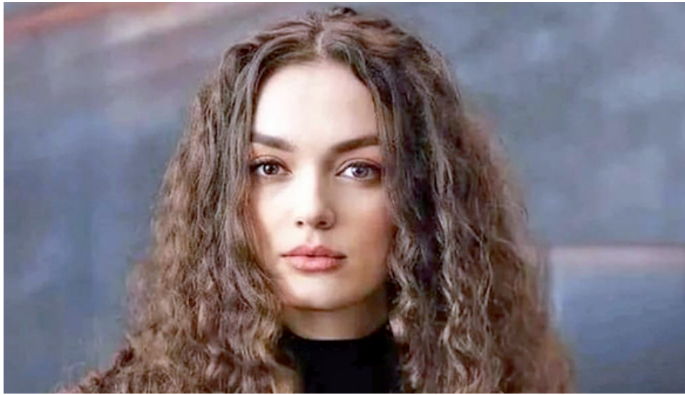
წვივის და დათანხმდა კიდევ:

თურქულ სერიალ „სხვისი შვილის“ მესამე სეზონის ჩვენება თურქულ არხ „Kanal 7“-ზე მალე დასრულდება (მისი გადაღებები მა-