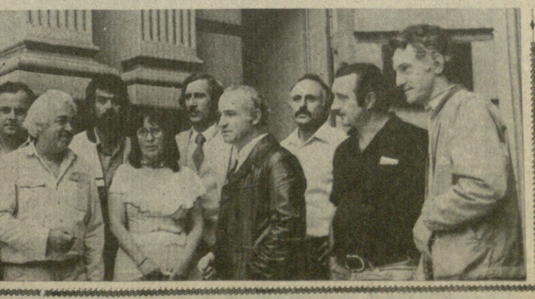
საბრძოლო საბჭოს 1982 წლის 16 სექტემბერის სესიის შედეგები