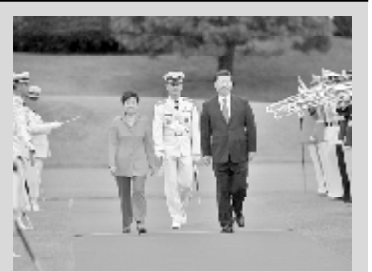
ჩინეთის სახალხო რესპუბლიკის თავმჯდომარე ჩავიდა სეულში ასობით ბიზნესმენის გარემოცვაში

სი ცინპინმა დაარღვია ძველი ტრადიცია და კორეის ნახევარკუნძულზე პირველ მრავალრიცხოვანი გაემგზავრა სეულს, და არა ფენიანს. ჩინეთის სახალხო რესპუბლიკასა და სამხრეთ კორეას შორის ურთიერთობებს განსაზღვრავს ეკონომიკური ინტერესები, ამჟამად კი ორი ქვეყნის ლიდერს იმედი აქვთ გამოიყენონ ურთიერთგაგება იაპონიის დემოკრატიისა და კორეის სახალხო-დემოკრატიული რესპუბლიკის ბირთვულ და სარაკეტო პრობლემებთან დაკავშირებით.