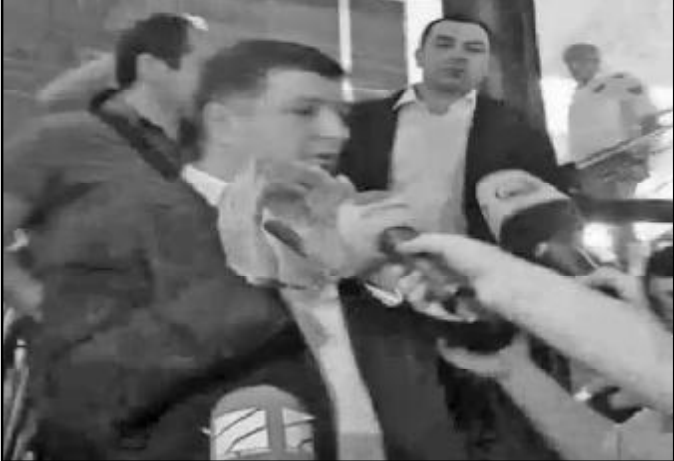
ნო შემოსავალს გადასცემდა გიორგი უგულავას, ერთიანი ნაციონალური მოძრაობის წინააღმდეგო კამპანიის დაფინანსების მიზნით. საერთო ჯამში, ოფშორული კომპანიიდან საქართველოში ფიქტიური ხელშეკ-