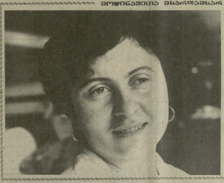
საპარტიო კომუნისტური პარტიის ცენტრალური კომიტეტის...