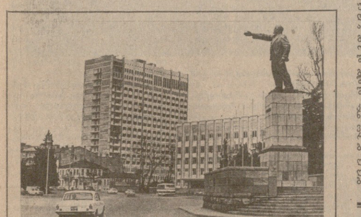
ბათუმი, ვ. ა. ლენინის მოედანი. 6. პანახაძის ფოტო. (საქინფორმის ფოტოგრაფია).

ალსინაშვილი, რომ თუ 1977 წელს შევიტყობთ მეთოდის დანერგვის შედეგად საბჭოთა კავშირის ეკონომიკის ზრდას 40 კაცი, სამი წლის შემდეგ — 875, რომელიც 1981 წელს წინა წლებთან შედარებით დაახლოებით 54 კაცი.