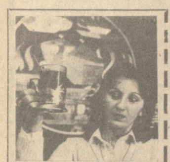
21-27 მაისი - პარტიული ჩინი სპირიტუალური

ლენა გაბა და ანთიკალური ბული შეიქმნა. ანთიკალური ბული შეიქმნა.